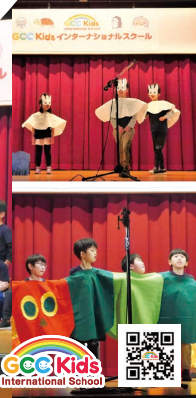
GCC Kids International School