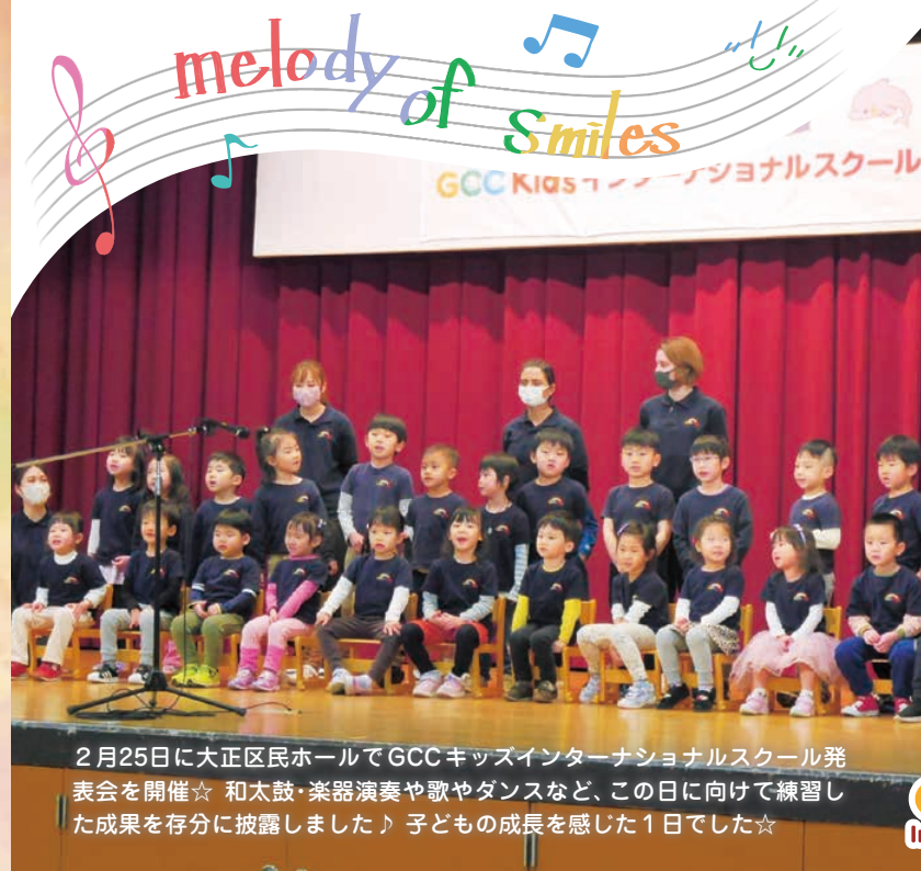
2月25日に大正区民ホールでGCCキッズインターナショナルスクール発表会を開催☆ 和太鼓・楽器演奏や歌やダンスなど、この日に向けて練習した成果を存分に披露しました♪ 子どもの成長を感じた1日でした☆